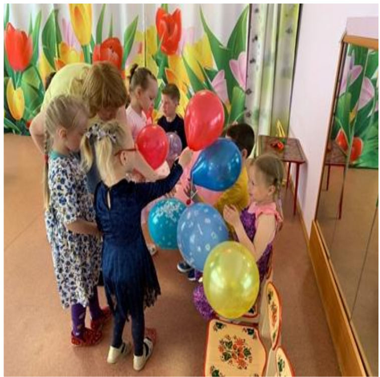
Провожаем в школу.....