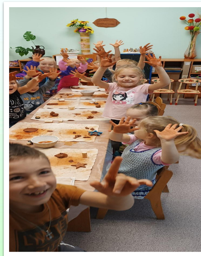
Ура! Глиняные фантазии...