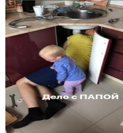
Дело с ПАПОЙ