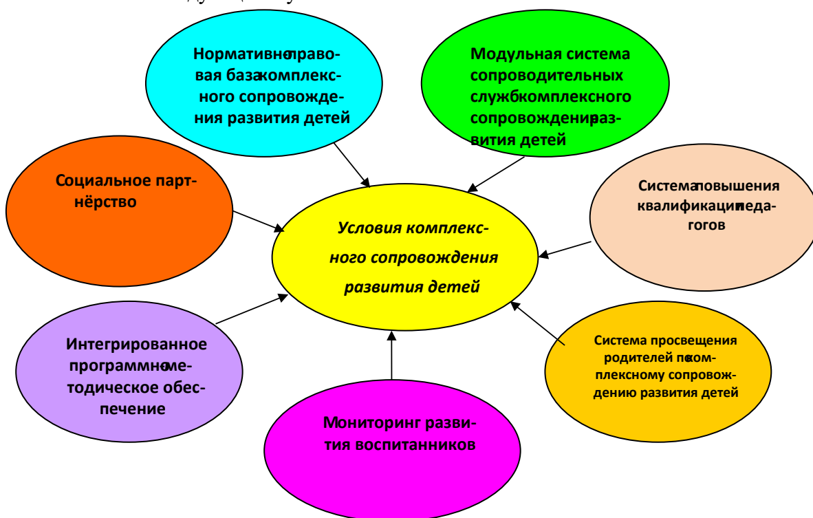
Рис.1 Условия комплексного сопровождения развития детей

Комплексное сопровождение развития воспитанников обеспечивает возможность полноценного взаимодействия с разными пространствами внутри Учреждения и обеспечивается следующими условиями.